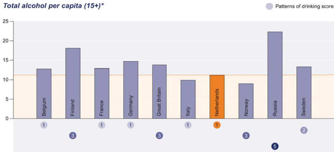
Total alcohol per capita (15+)*

* drinkers only (in litres of pure alcohol)